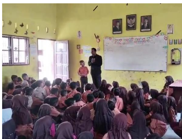
Gambar 2 Sesi Dialog Ringan

Sesi dialog ringan memberikan ruang bagi siswa untuk berbagi pengalaman bencana banjir yang mereka rasakan. Sesi ini dirancang tidak sebagai terapi formal, melainkan sebagai percakapan hangat yang membuat anak merasa didengar dan dipahami. Proses ini penting karena salah satu penyebab trauma yang berkepanjangan adalah perasaan tidak diakui atas apa yang telah dialami korban. Guru-guru yang mendampingi melaporkan bahwa sesi dialog ini membuat banyak siswa yang sebelumnya pendiam dan murung mulai berani berbicara dan mengungkapkan perasaan mereka.