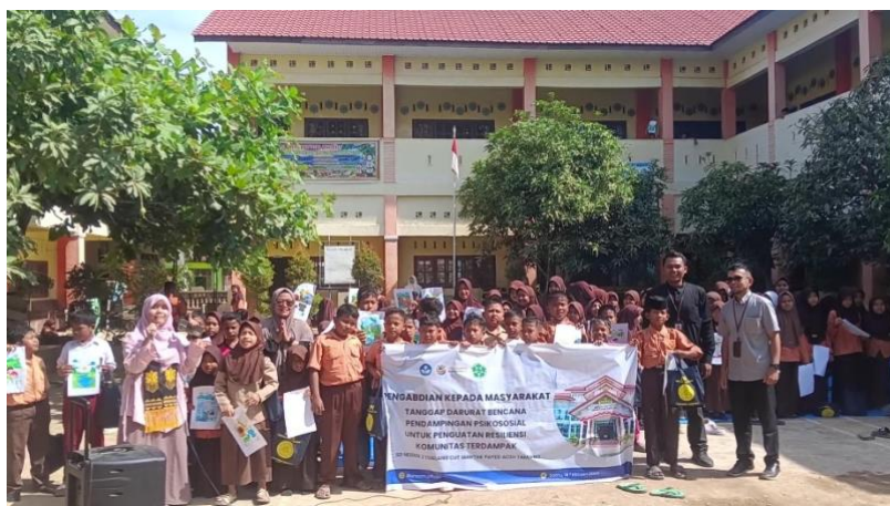
Gambar 5 Dokumentasi Bersama

Hasil monitoring yang dilakukan melalui wawancara dengan kepala sekolah dan guru-guru kelas menunjukkan perubahan positif yang signifikan pada kondisi psikososial siswa pascakegiatan. Guru melaporkan bahwa siswa yang sebelumnya tampak murung, pendiam, dan kehilangan semangat belajar, kini terlihat lebih ceria, lebih termotivasi dalam mengikuti pembelajaran, dan lebih aktif berinteraksi dengan teman-temannya. Perubahan ini konsisten dengan temuan sejumlah penelitian sebelumnya. Program trauma healing yang menggunakan pendekatan interaktif dan menyenangkan terbukti mampu mengubah perilaku anak dari semula pasif menjadi lebih ceria dan berani berinteraksi, serta menumbuhkan kembali rasa aman pascabencana (Syafitri et al., 2026).