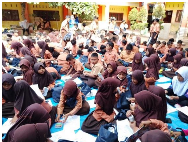
Gambar 3 Pembagian Paket ATK dan Makanan Ringan

Ekspresi kreatif melalui mewarnai gambar menjadi kegiatan yang paling menggembirakan dan interaktif. Setiap siswa menerima paket crayon dan buku mewarnai, kemudian bebas mengekspresikan diri melalui warna dan gambar. Kegiatan mewarnai dan menggambar terbukti mampu membantu anak-anak dalam mengekspresikan diri, meredakan kecemasan, meningkatkan suasana hati, serta mendorong kreativitas dan konsentrasi (Al Fayed et al, 2023). Suasana kelas berubah menjadi penuh tawa dan keceriaan selama sesi ini berlangsung, yang merupakan indikator awal pemulihan kondisi emosional yang positif.