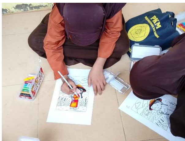
Gambar 4 Sesi Ekspresi Kreatif

Ekspresi kreatif melalui mewarnai gambar menjadi kegiatan yang paling menggembirakan dan interaktif. Setiap siswa menerima paket crayon dan buku mewarnai, kemudian bebas mengekspresikan diri melalui warna dan gambar. Kegiatan mewarnai dan menggambar terbukti mampu membantu anak-anak dalam mengekspresikan diri, meredakan kecemasan, meningkatkan suasana hati, serta mendorong kreativitas dan konsentrasi (Al Fayed et al, 2023). Suasana kelas berubah menjadi penuh tawa dan keceriaan selama sesi ini berlangsung, yang merupakan indikator awal pemulihan kondisi emosional yang positif.