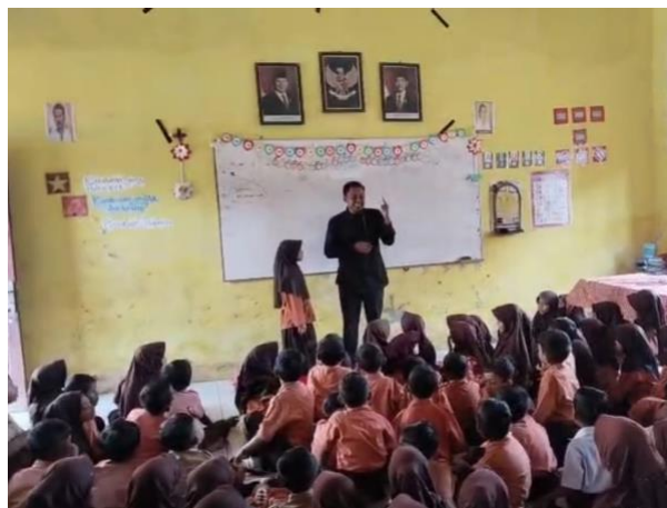
Gambar 1 Sesi Bercerita Islam

Sesi dialog ringan memberikan ruang bagi siswa untuk berbagi pengalaman bencana banjir yang mereka rasakan. Sesi ini dirancang tidak sebagai terapi formal, melainkan sebagai percakapan hangat yang membuat anak merasa didengar dan dipahami. Proses ini penting karena salah satu penyebab trauma yang berkepanjangan adalah perasaan tidak diakui atas apa yang telah dialami korban. Guru-guru yang mendampingi melaporkan bahwa sesi dialog ini membuat banyak siswa yang sebelumnya pendiam dan murung mulai berani berbicara dan mengungkapkan perasaan mereka.